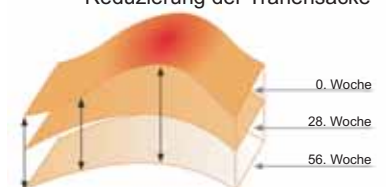
Reduzierung der Tränensäcke

EYE-LISS® entfernt und behandelt die Tränensäcke unter den Augen (es verbessert das Erscheinungsbild und hilft ihr Volumen zu reduzieren).